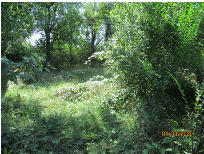
Slika 5: Neurejeno stavbno zemljišče v Zrečah