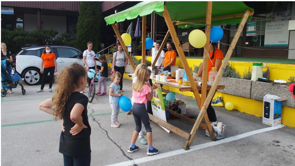
(Evropski teden mobilnosti, september 2020)