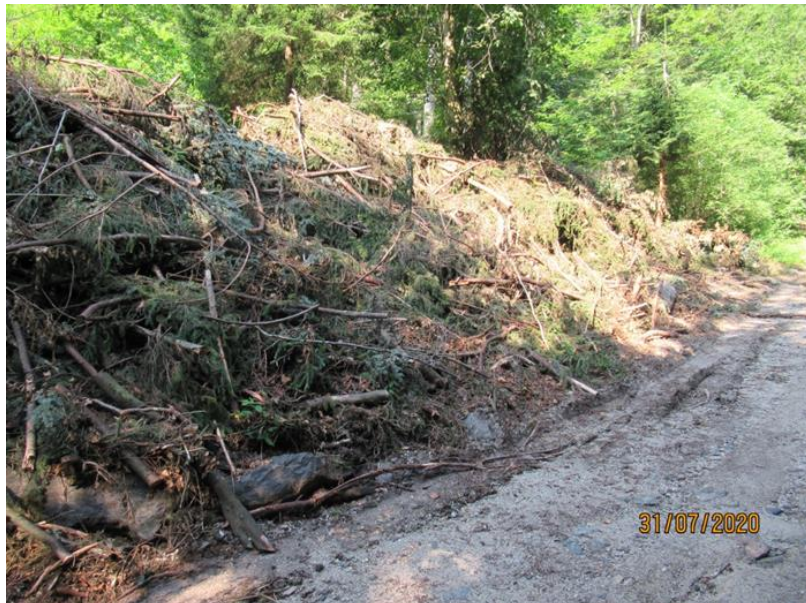
Slika 1: Ostanke sečnje v cestnem svetu, poškodbe cestišča

Problem ostaja predvsem tam, kjer kategorizirana občinska cesta še vedno poteka po zemljiščih v zasebni lasti, saj so v teh primerih nemočni.