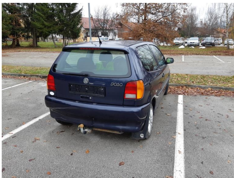
Slika 3: Zapuščeno vozilo na javnem parkirišču

Na področju zapuščenih in izrabljenih vozil so v letu 2020 obravnavali 3 primere, kjer so lastniki po izdani odredbi vozila sami odstranili.