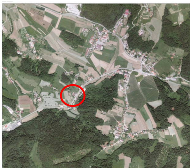
Slika 3: širši prikaz v prostoru – digitalni ortofoto posnetek