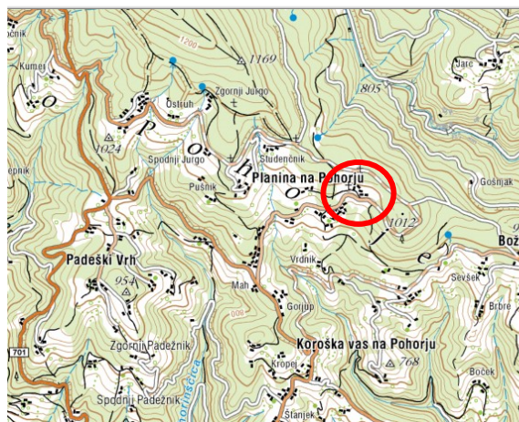
Slika 2: širši prikaz v prostoru – topografija