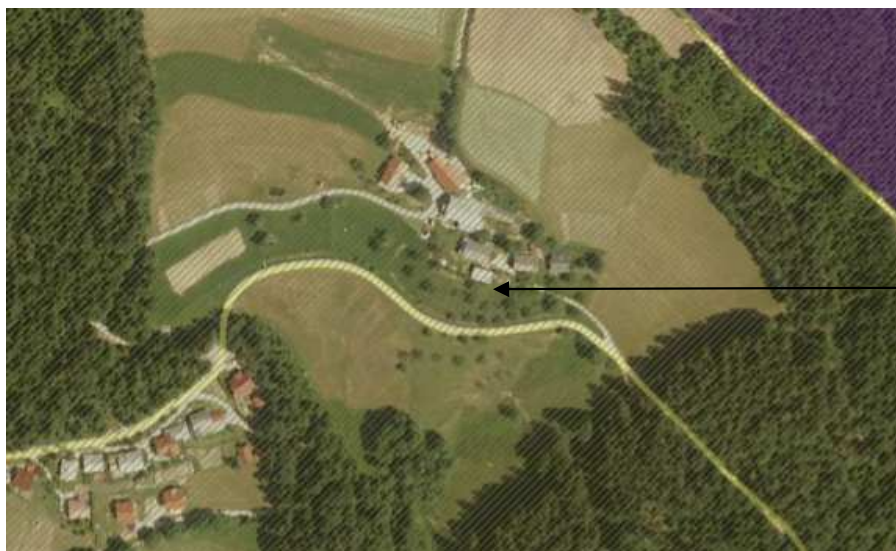
Slika 4: Prikaz območij ohranjanja narave