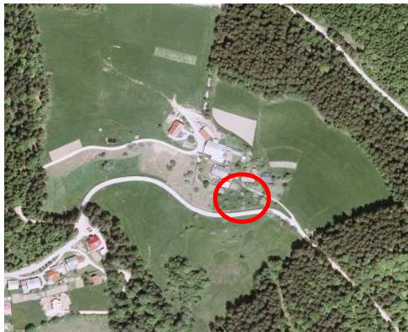
Slika 3: širši prikaz v prostoru – digitalni ortofoto posnetek