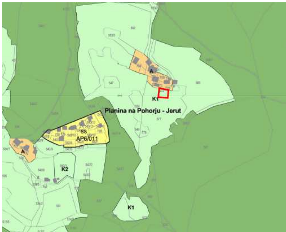
Slika 1: Izrez iz občinskega prostorskega načrta

Na obravnavanem izvornem območju še ni bilo izvedene lokacijske preveritve.