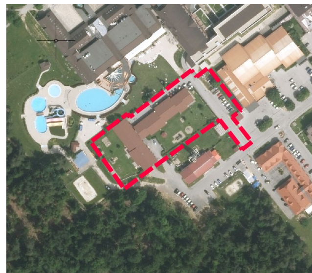
Slika: prikaz območja na orto-foto posnetku

Objekt vrtca je priključen na gospodarsko javno infrastrukturo. Prostorski akt omogoča obnovo teh priključkov ter omogoča tudi izgradnjo novega priključka na plinovodno omrežje.