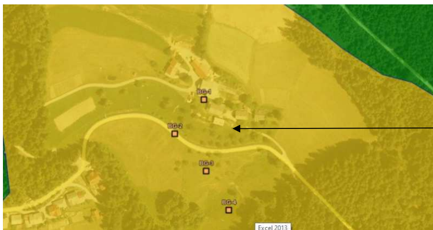
Slika 5: Prikaz vodovarstvenih območij

Natura 2000, Direktiva o habitatih (pSCI, SAC9)