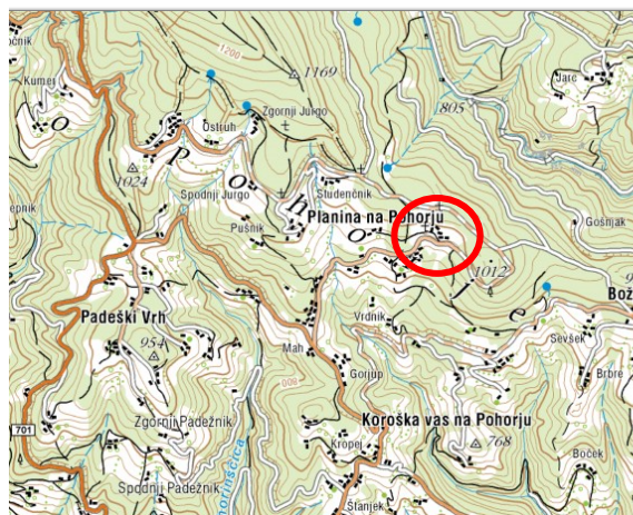
Slika 2: širši prikaz v prostoru – topografija