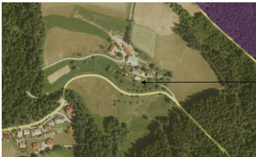
Slika 4: Prikaz območij ohranjanja narave (vir: www.geoprostor.net/piso )