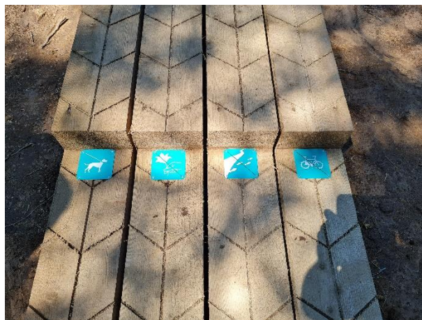
Slika št. 2 in 3 : Obnova in nadgradnja brunčanih poti s piktogrami